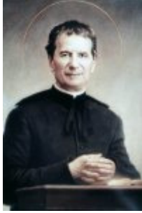
św. Jan Bosco