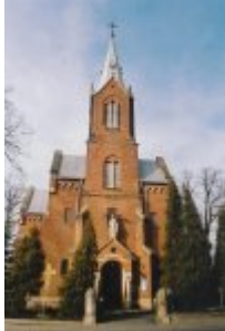
Kościół parafialny w Miejscu Piastowym