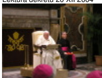
Lektura dekretu 20 XII 2004

Papież Jan Paweł II ogłosił dekret o heroicznosci cnót Czcigodnego Sługi Bożego ks. Bronisława Markiewicza.